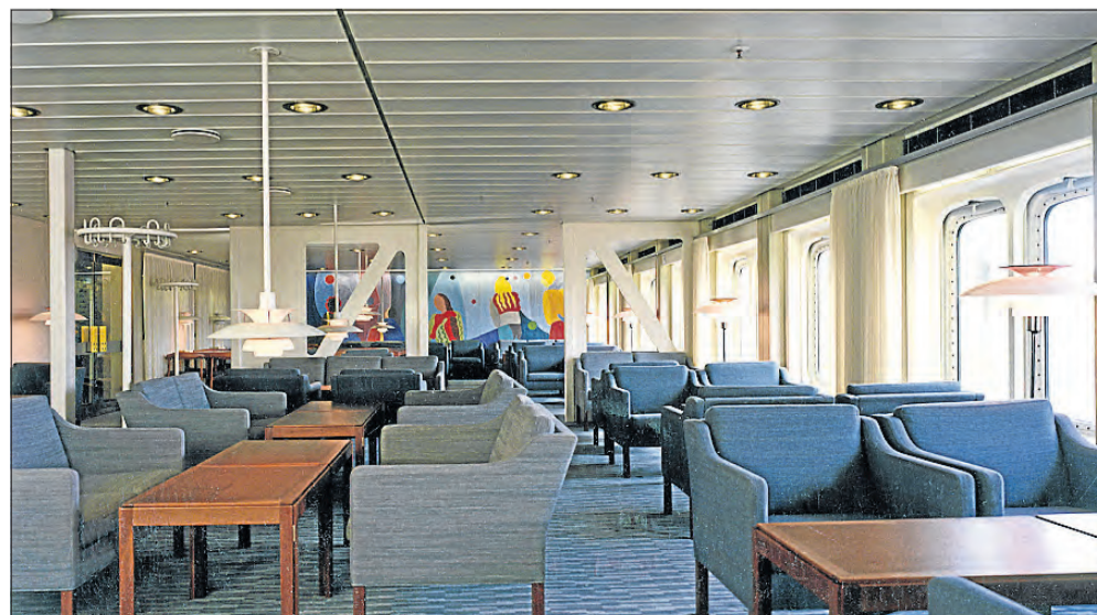
Business class lounge-område om bord på 'Peder Paars'. Foto fra bogen