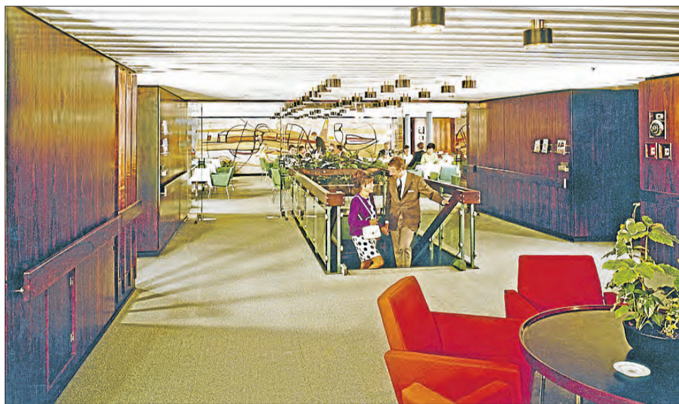
Så smukt så det ud. Øjeblikbillede fra skibet 'Winston Churchill.

Bogen om dansk skibsdesign 'Ship Interior Architecture and Furnishing' er blevet støttet af DFDS og af Sunstone. Forlaget er Nautilus, en del af Polyteknisk Forlag. ISBN is 9788790924218. Listeprijs er DKR 249.00. https://www.polyteknisk.dk/home/nautilus