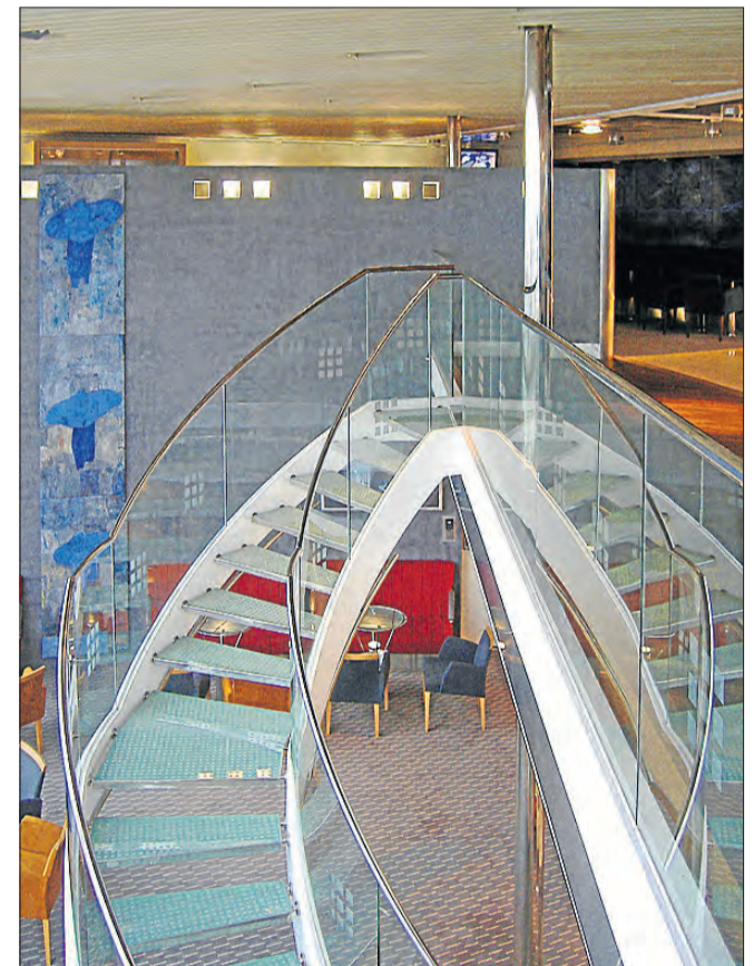
Trappeopsats om bord på 'Maersk Delft'.

Bogen om dansk skibsdesign 'Ship Interior Architecture and Furnishing' er blevet støttet af DFDS og af Sunstone. Forlaget er Nautilus, en del af Polyteknisk Forlag. ISBN is 9788790924218. Listeprijs er DKR 249.00. https://www.polyteknisk.dk/home/nautilus