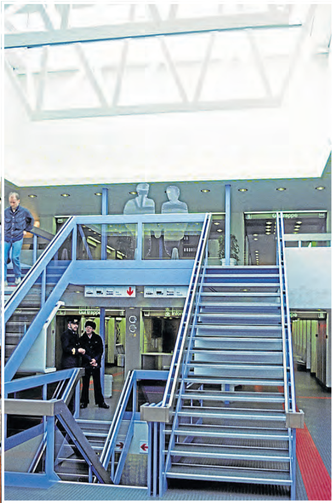
Den centralt beliggende blå trappe om bord på 'Niels Klim', der som bekendt sejlede mellem Aarhus og Kalundborg i en årrække.